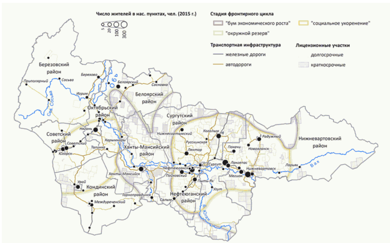
Рис. 3. Пространственное развитие Ханты-Мансийского автономного округа - Югры (2015)