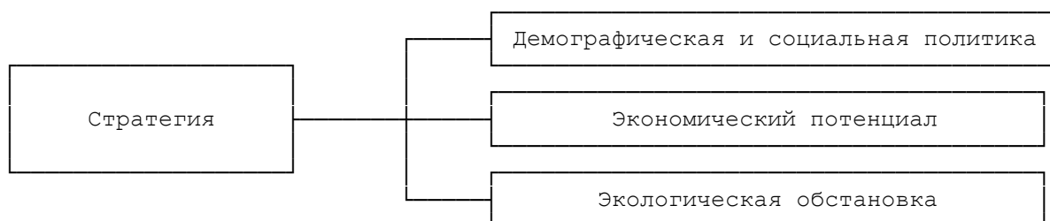
Рис. 1. Основные блоки Стратегии

Стратегия включает в себя три основных блока: демографическая и социальная политика, экономический потенциал, экологическая обстановка (см. рис. 1 ).