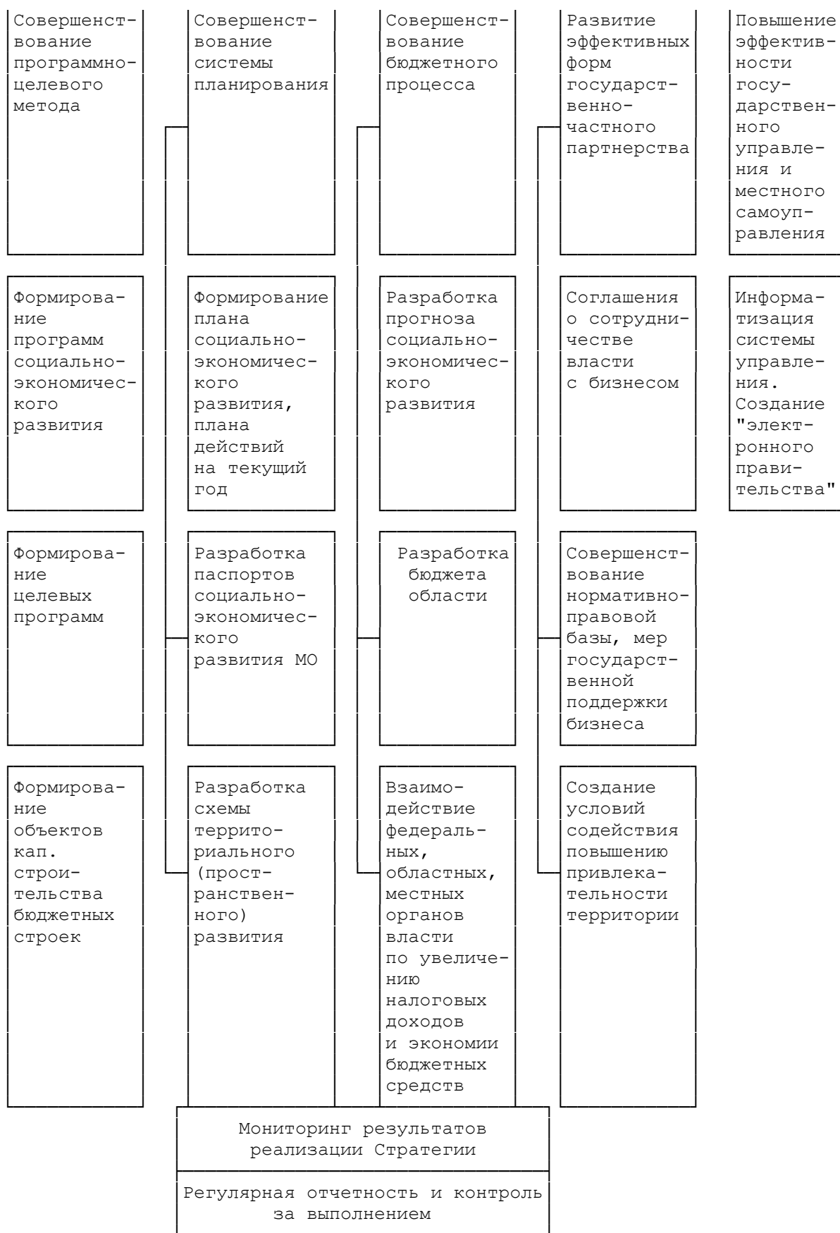
Рис. 10. Механизм реализации Стратегии

Совершенствование программно-целевого метода. В Волгоградской области действует программно-целевой метод управления экономическим развитием, увязанный с основными